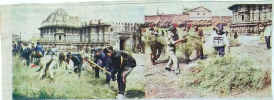
खिद्रापूर : येथील ऐतिहासिक कोपेश्वर मंदिराची इचलकरंजीतील एनसीसीच्या मुलांनी स्वच्छता केली, त्यानंतर परिसरातील असा मोठ्या प्रमाणात कचरा विद्यार्थ्यांनी एकत्र केला.