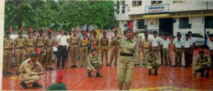
इचलकरंजी : येथील डीकेएससी महाविद्यालयात कारगिल विजय दिवसप्रसंगी पथनाट्य करताना एनसीसी विद्यार्थी.