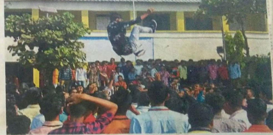
इचलकरंजी : १) डोल-ताशाच्या तालावर ठेका धरत युवतींनी आनंद घेतला. २) युवकांनी हौशी कलागुण सावर करत मनमुरादपणे मनोरंजन केले.