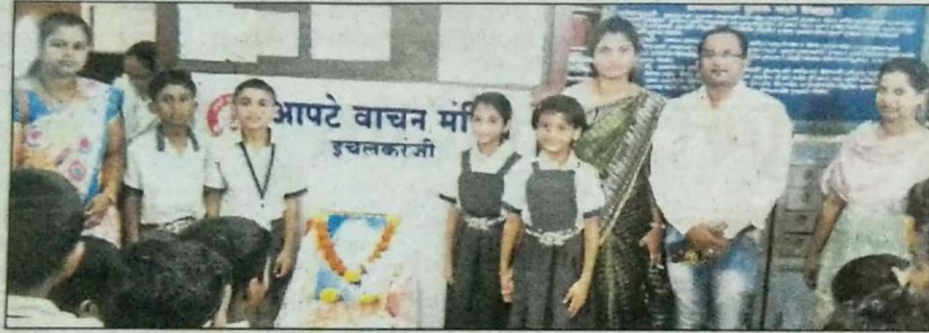
इचलकरंजी : आपटे वाचन मंदिरामध्ये वाचन प्रेरणा दिनानिमित्त माजी राष्ट्रपती डॉ. ए. पी. जे. अब्दुल कलाम यांच्या प्रतिमेचे पूजनप्रसंगी समर्थ विद्यामंदिरचे शिक्षक व विद्यार्थी.